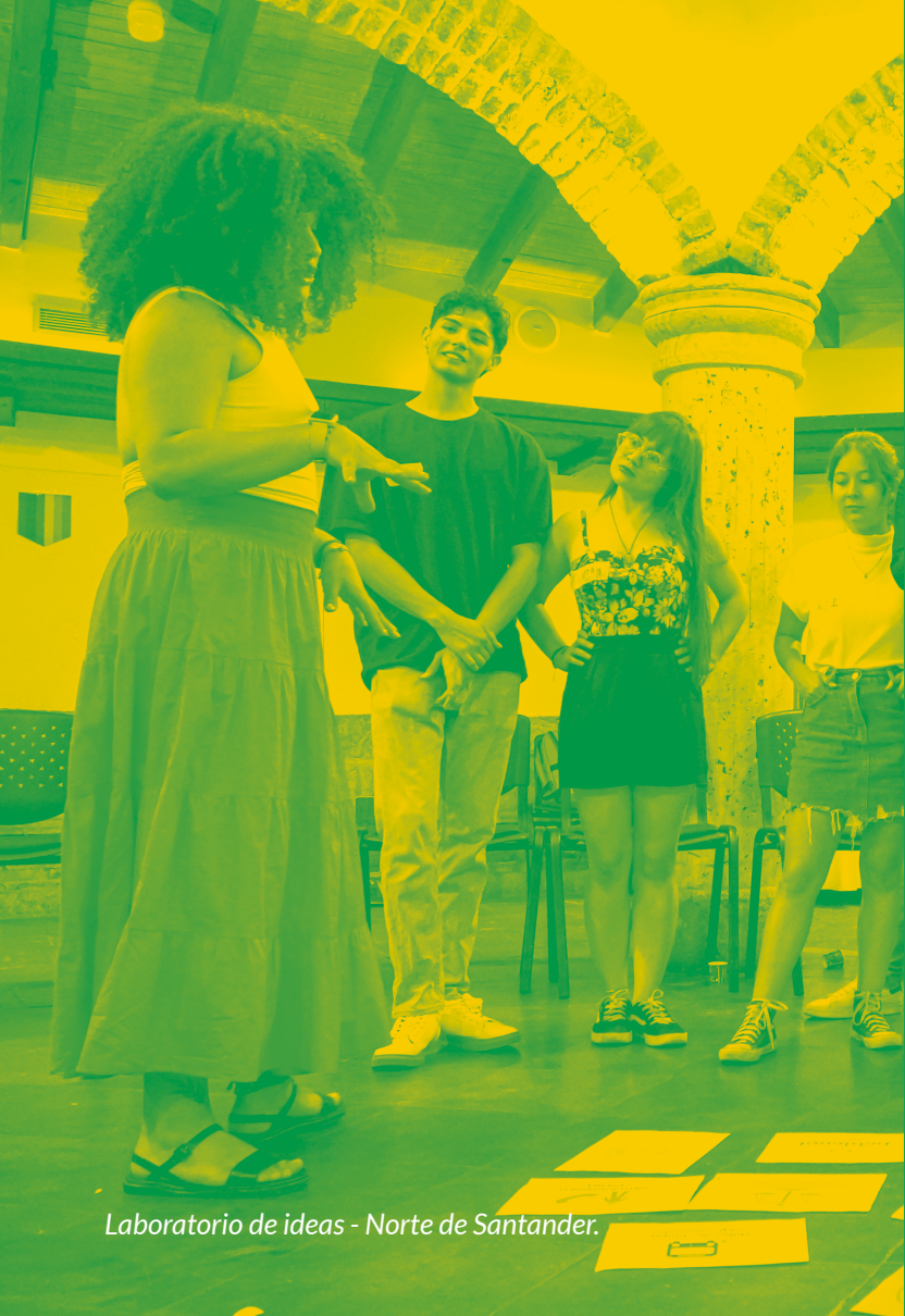
Laboratorio de ideas - Norte de Santander.