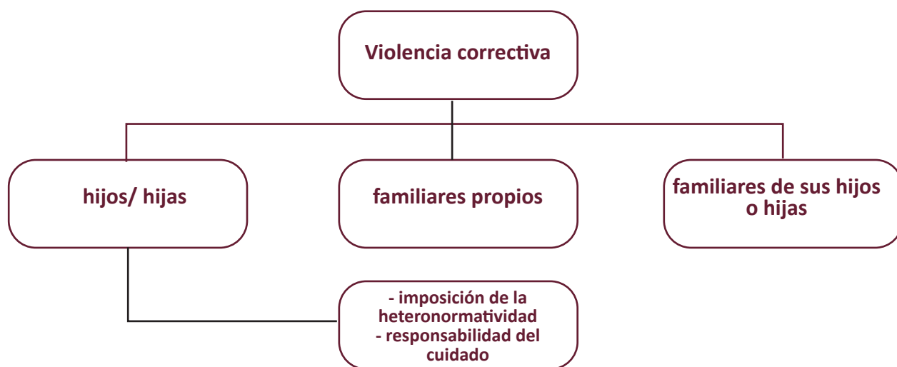
Figura 1. Actores y prácticas de las violencias

Elaborado por equipo de investigación de Caribe Afirmativo