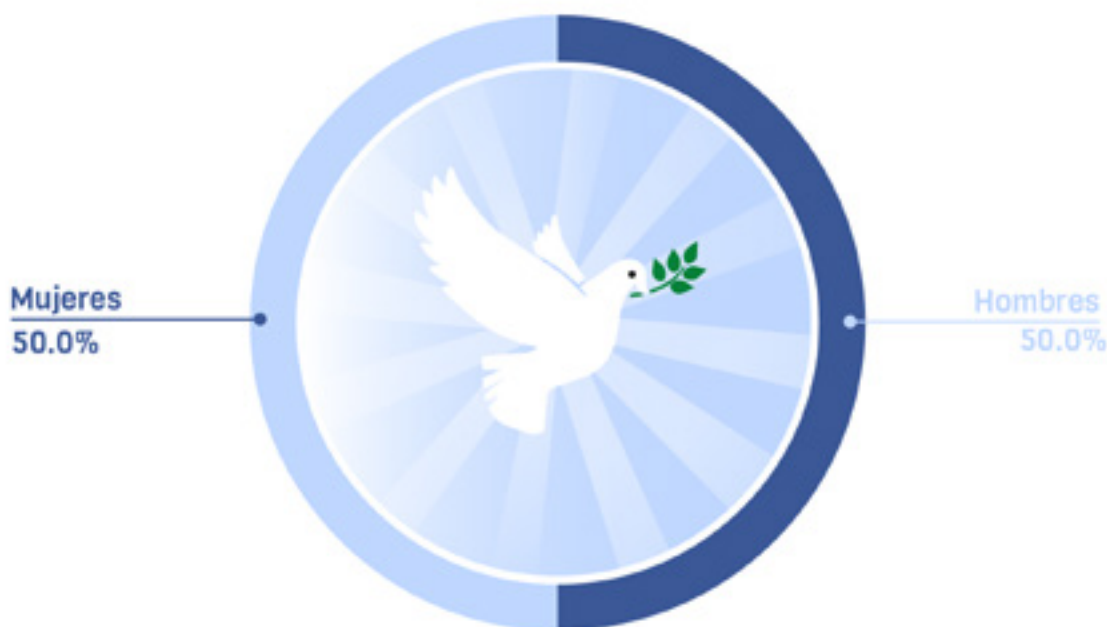
Candidaturas a CTEP en Sur de Córdoba

En el Sur de Córdoba se encuentran 18 candidaturas a la circunscripción. Entre estas, 9 son mujeres. En el Sur de Córdoba existe un grave riesgo de fraude electoral y de riesgo por factores de violencia, como fue evidenciado en el informe presentado por la Misión de Observación Electoral.