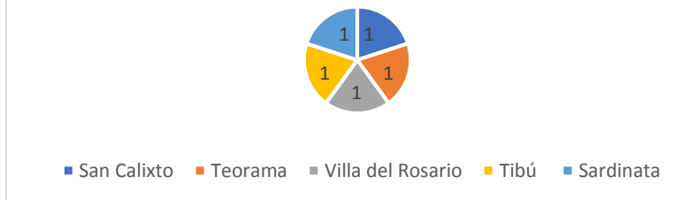
Gráfico No.2. Elaboración propia. Caribe Afirmativo (2020)

En la siguiente tabla, se detallan las actividades por municipio.