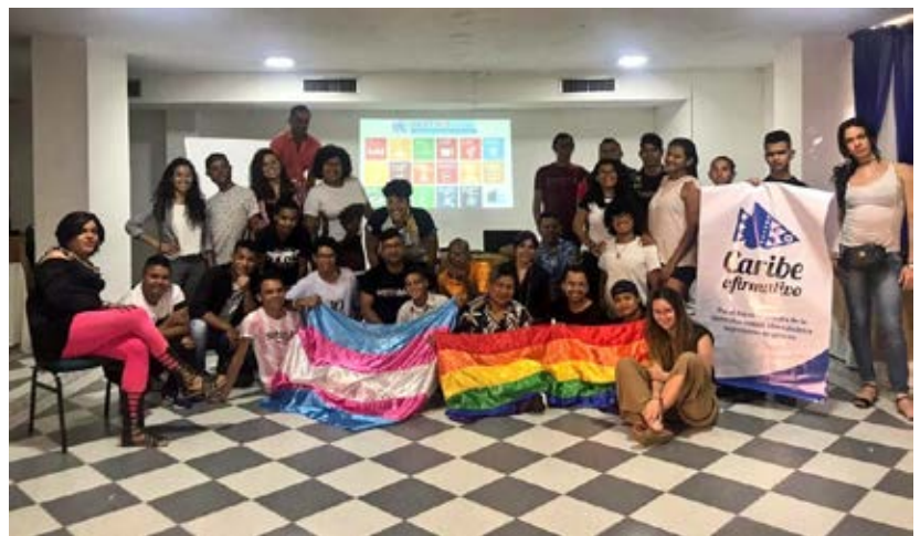
Cierre de Casas de Paz

Durante este año las casas de paz han sido espacios de deliberación e integración, no sólo para personas LGBTI sino para toda la población de los territorios donde se hace incidencia. Desde las Casa de Paz entendemos la importancia de trabajar con la población LGBTI, pero de igual forma entendemos que es a través de los procesos de sensibilización a todas las personas del territorio que se logra un goce efectivo de los derechos y un respeto por la diversidad.