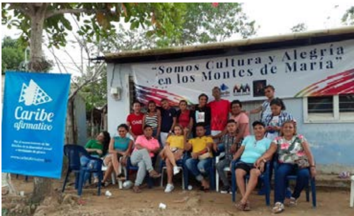
Carmen de Bolívar