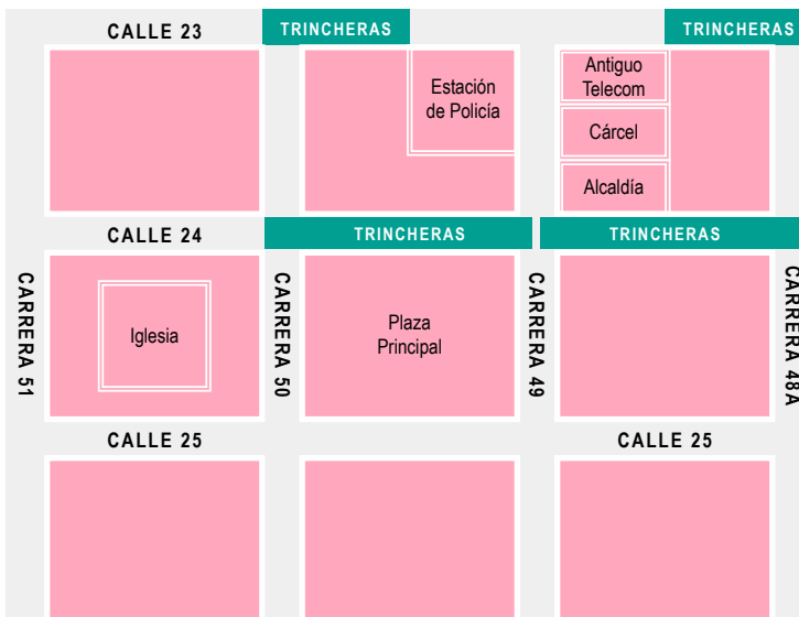
Gráfico 1. Ubicación de los espacios institucionales estatales donde la Policía perpetraba violencias por prejuicio contra las personas LGBT en El Carmen de Bolívar (2001–2004).

Elaboración propia del equipo de Caribe Afirmativo (2019), a partir de la observación y los diarios de trabajo de campo.