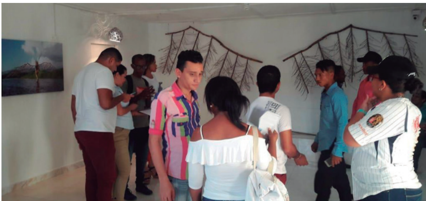
Performan realizado en Maicao, Guajira donde se pueden ver los elementos que simbolizan el proceso de construcción de la memoria (Borlas rojas, estructura de trupillo)

El Carmen de Bolívar se encuentra ubicado en los Montes de María, un territorio rodeado por hermosas montañas y frondosa vegetación donde habitan un sin número de especies que adornan con caminos por donde día a día los campesinos de esta Región transitan con sus grandes cargas de aguacate, tabaco y/o ajonjolí, productos que se cosechan en esta Región.