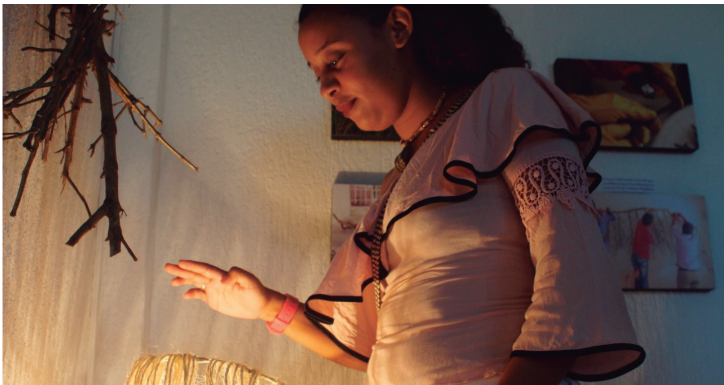
Trabajo escenográfico realizado en la Casa de Paz de El Carmen de Bolívar

taban los colores del arcoíris. El performance que permitió mostrar la resiliencia y las luchas de esta población fue realizado en la Alta Montaña, territorio golpeado de manera directa por el conflicto armado, donde el performance buscaba dar vida a ese lugar dejando atrás las historias de muertes y sacrificios perpetuados por grupos al margen de la ley a la población civil. Es así como el brillo de las piedras alumbró el lugar como luciérnagas que iluminan los caminos, haciendo de guías de los campesinos que por allí transitan.