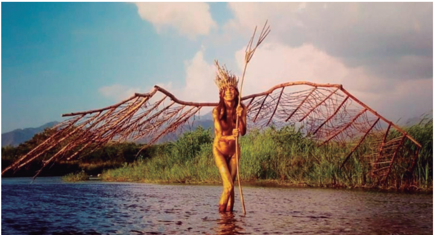
Apuesta escenográfica de la Casa de Paz de Ciénaga.

El municipio de Ciénaga hace parte de la Zona Bananera, este territorio rodeado precisamente por las grandes hojas de las matas de plátano y banano que parecen enseñorearse de cada lugar de esta zona. La travesía por esta zona permite ver la línea del tren que en un tiempo fue vía de progreso de este territorio.