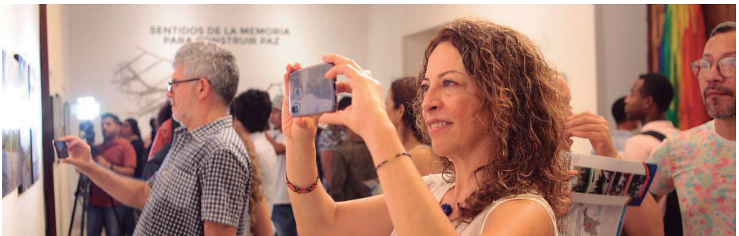
Fotografías tomada durante el recorrido de la exposición

Los laboratorios de creación estuvieron dirigidos por el artista plástico Dayro Carrasquilla y tuvo como curador de la muestra al artista plástico Edgar Plata. Esta exposición es resultado de una serie de laboratorios de creación artística donde se implementaron estrategias pedagógicas para realizar procesos de creación colectiva, a partir de la exploración de la intervención corporal y la fotografía escenográfica.