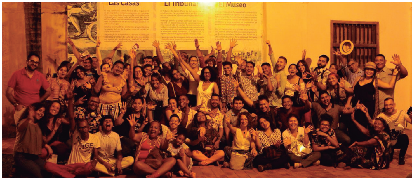
En la fotografía el equipo de Caribe Afirmativo y algunas personas que asistieron a la inauguración.