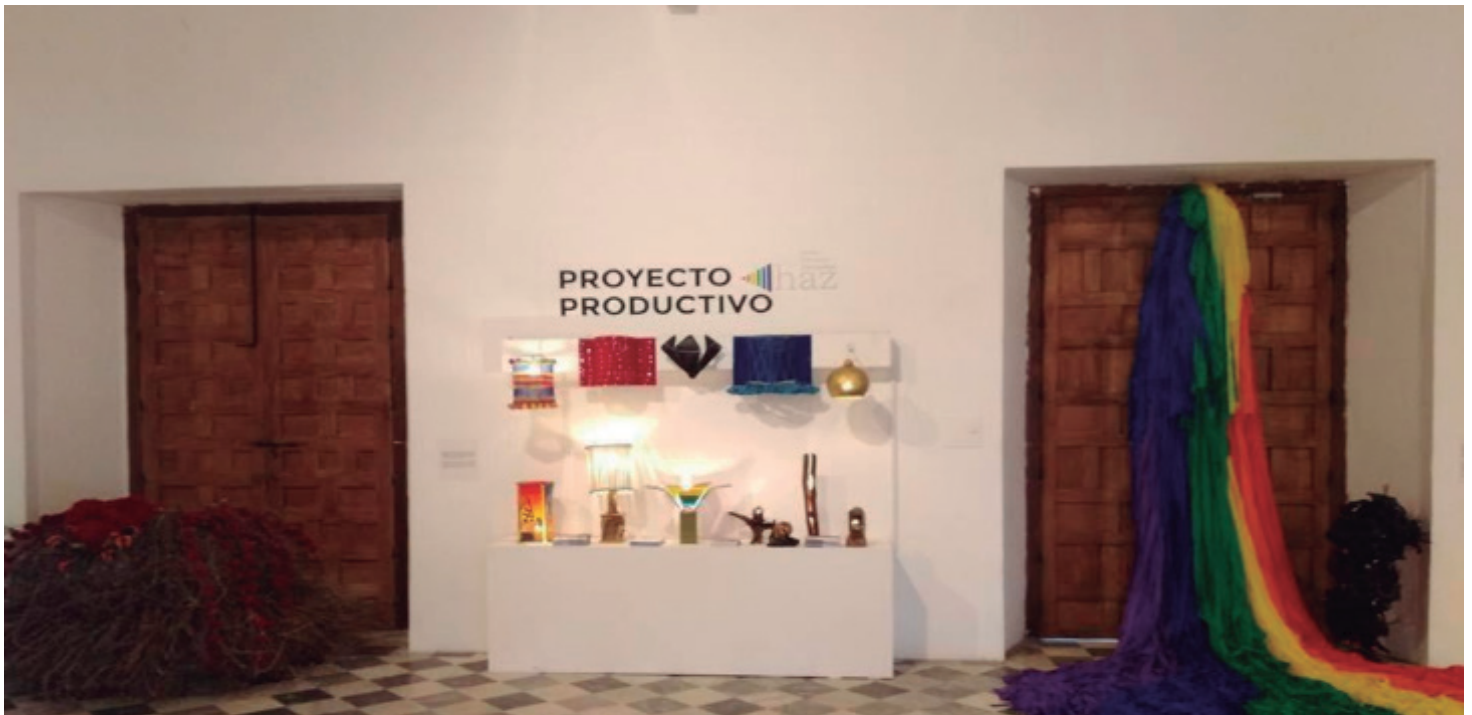
Lámparas realizadas por personas LGBT durante los laboratorios de creación artística