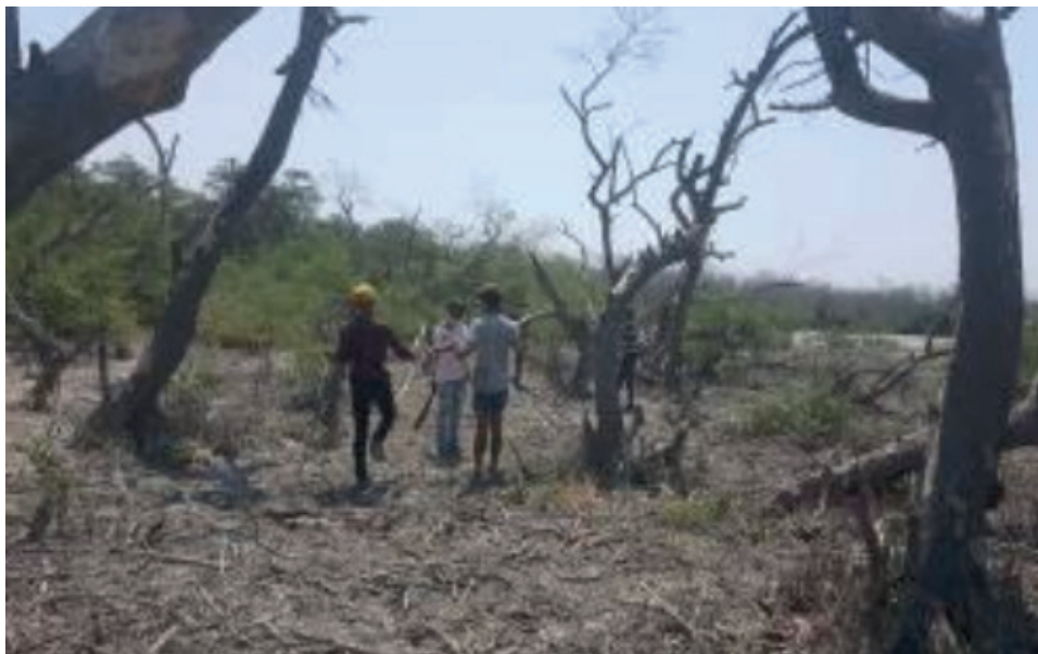
Muestra fotográfica de Ciénaga.

construida a partir de la fragilidad y desnudez de una mejer trans pintada de color dorado, la cual se mantiene en pie soportando el pesos de las alas en medio de la desembocadura del río, zona en la que se han presentado agresiones a la comunidad LGBT.