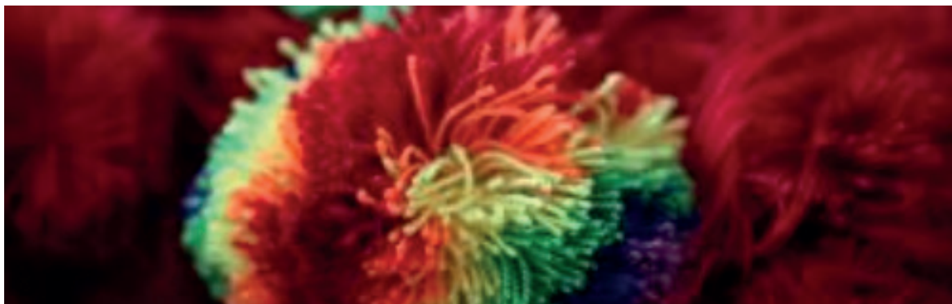
Borlas realizadas por las y los usuario