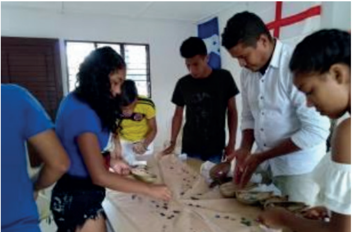
Elaboración del vestido.

El material con que se sintió afinidad para el trabajo creativo y de emprendimiento fue el fruto del totumo, procesándolo para realizar lámparas con diseños realizados con taladro.