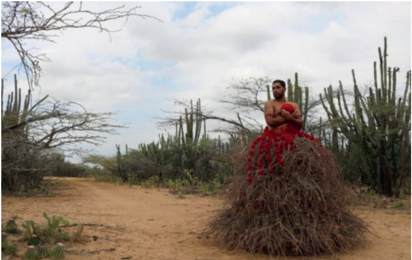
Muestra fotográfica en Maicao.

borlas que permiten dar continuidad al homenaje ofrecido a las víctimas mortales LGBT de este territorio.