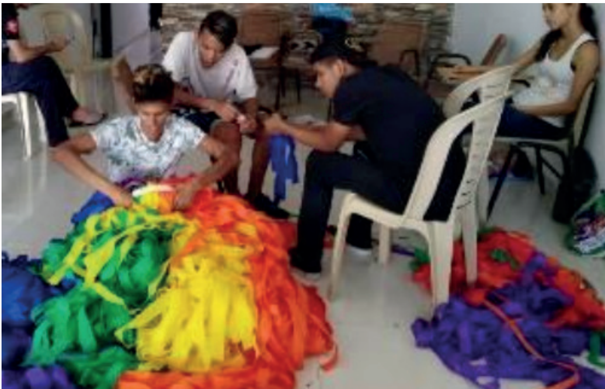
Elaboración de la peluca.

dar homenaje a las víctimas violentadas y mortales a través de una rama de cayenas negras que contrasta simbólicamente con la exposición de la desnudez del modelo simulada con una trusa.