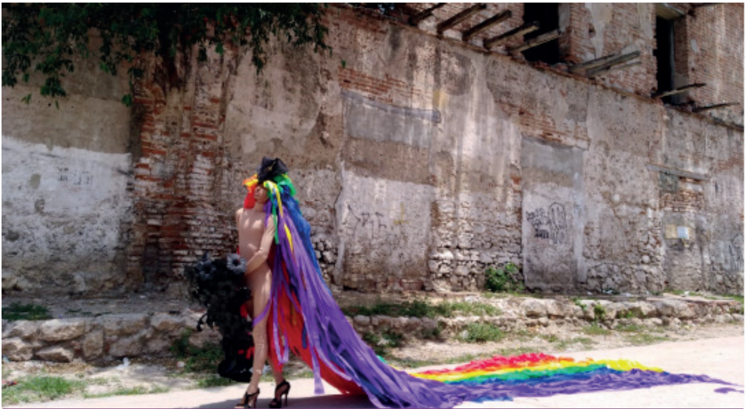
Muestra fotográfica de Soledad.

Soledad es un municipio con un porcentaje alto de Comunidad LGBT abiertamente reconocida, lo que da la impresión de ser un territorio respetuoso hacia la diversidad, lastimosamente se presentan manifestaciones de violencia y odio; los integrantes de la casa de paz plantearon una propuesta de intervención corporal con la que buscan revisibilizar a la comunidad LGBT a través de una peluca de aproximadamente 5 metros de largo realizada en material borlan, expandiéndose en el territorio como un gran arcoíris humano, de la misma manera acordar brin-