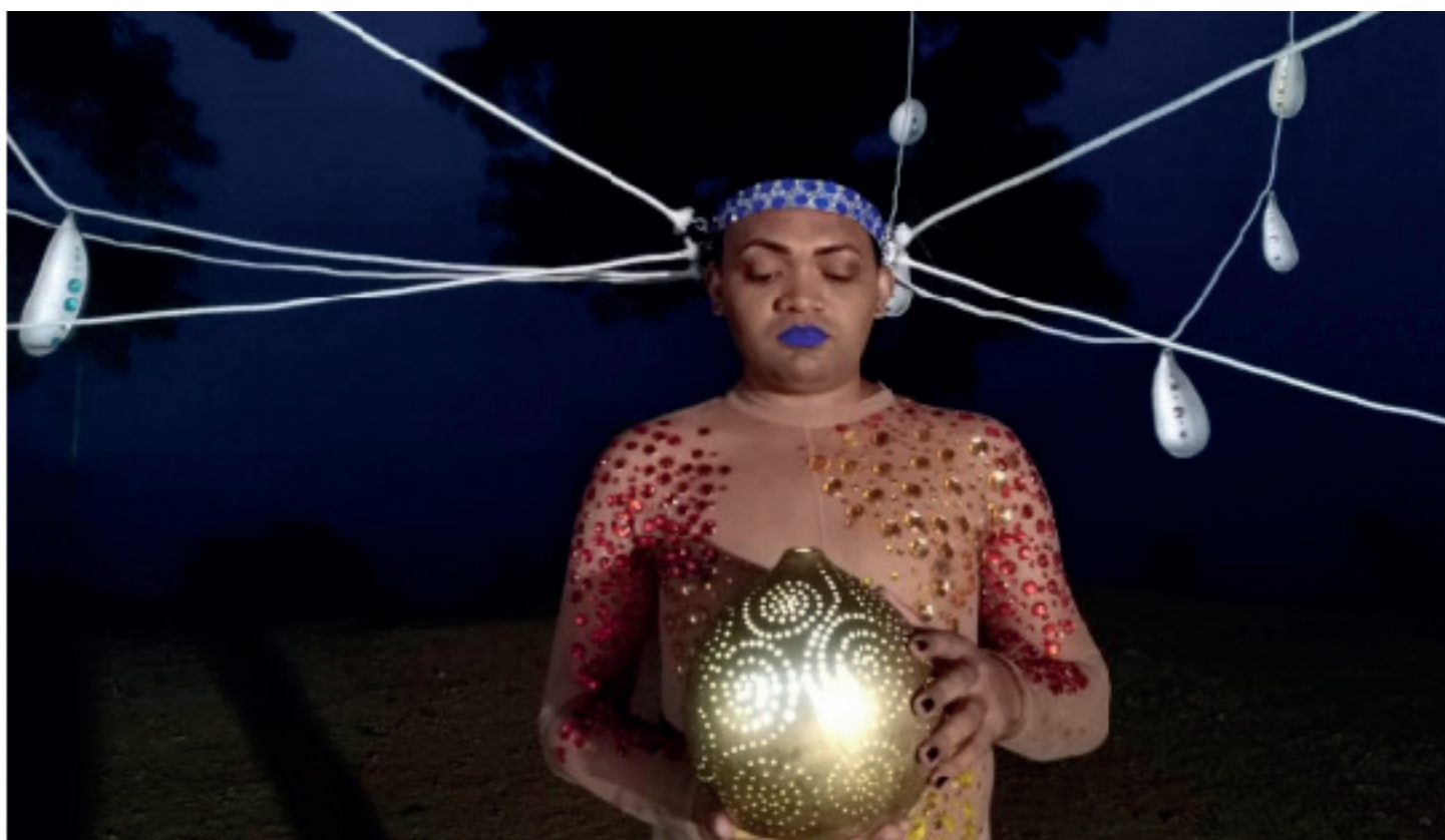
Muestra fotográfica de El Carmen de Bolívar.

Los participantes de la Casa de Paz del municipio del Carmen de Bolívar centraron su interés en la realización de metáforas establecida con la conservación de la memoria, la resignificación de los territorios violentados y estigmatizados con la historia de violencia de los Montes de María; por lo que plantearon el diseño de una constelación con pedrerías con los colores de la bandera LGBT