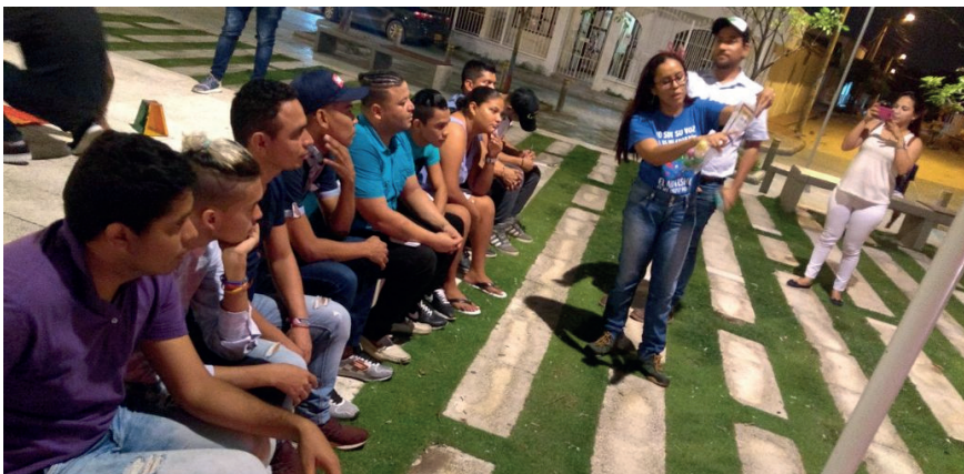
Capacitación sobre prevención y atención de hepatitis B con líderes y lideresas de Soledad.

compromiso de recordarlos en la vida cotidiana, sino garantizar que las nuevas generaciones de personas LGBT soledañías puedan vivir con paz y dignidad.