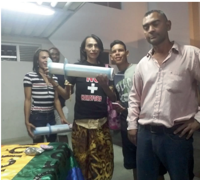
Vacuna contra la homofobia y transfobia a funcionarios públicos en Maicao.

Este espacio sirvió para abrazarnos con os hermanos y hermanas LGBT venezolanos y asumir un compromiso con ellos y ellas que nuestra casa es su casa y que no hay fronteras en el ejercicio de la búsqueda de la igualdad y el respeto a la diversidad.