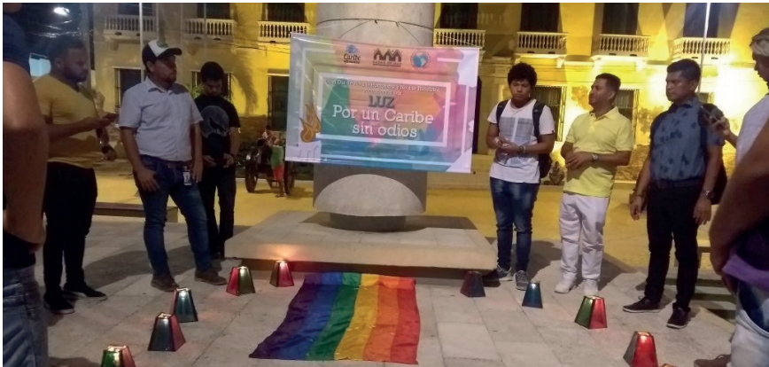
Alcaldía de Soledad acompaña acto simbólico en el día de No a la homofobia y transfobia.