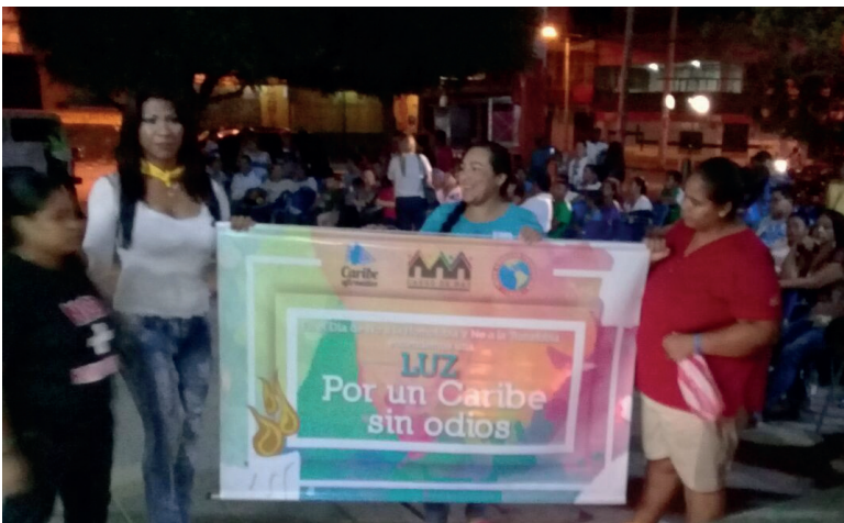
Lideresas lesbianas y Trans en movilización contra el odio en Maicao.

nuar con esta labor y para emprender más acciones relacionadas con el empoderamiento de las personas LGBT y la defensa de sus derechos.