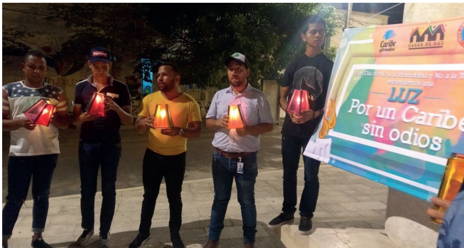
Jóvenes LGBT de en acto en memoria a las Víctimas en Soledad.

En soledad los faroles en la plaza del museo bolivariano convocaron a la solidaridad de la comunidad con la lucha por el reconocimiento de las personas LGBT.