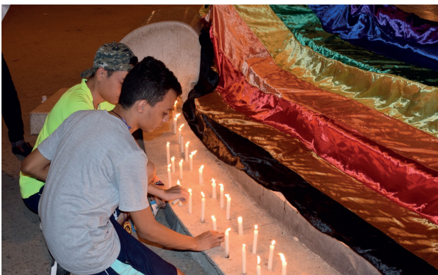
Jóvenes LGBT encienden luces contra el odio en plaza pública de Ciénaga.

Se puede rescatar entre otras cosas, el trabajo en equipo de las dos mesas de LGBT del municipio, ya que es esta la primera actividad que se desarrolla de manera conjunta y en la que además se contó con total participación de varios grupos poblacionales.