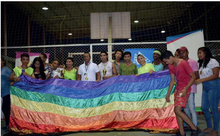
Campeonato deportivo contra el odio en Ciénaga.

aproximada de 2 horas en dicha plaza, la cual es de gran afluencia de en el municipio, por lo que se contó con la compañía de más de sesenta personas entre personas LGBT y sociedad civil, los cuales se vieron muy receptivos a lo socializado en el desarrollo de la actividad.