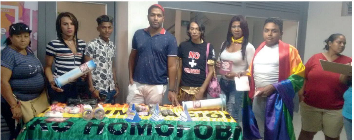
Mesa LGBT de Maicao se prepara para jornada colectiva municipal.

De por parte de la Casa de Paz del municipio de Maicao, La Guajira, una actividad simbólica en rechazo a la homofobia y transfobia, acto que inicio con una caravana por las principales calles del municipio, a fin de visibilizar la conmemoración del día de No a la Homofobia y No a la transfobia e invitar a la comunidad a participar en el acto teatral que se encontraba programado luego de dicha movilización, que se desarrollaría en la Plazoleta de la Casa de la Cultura del Municipio.