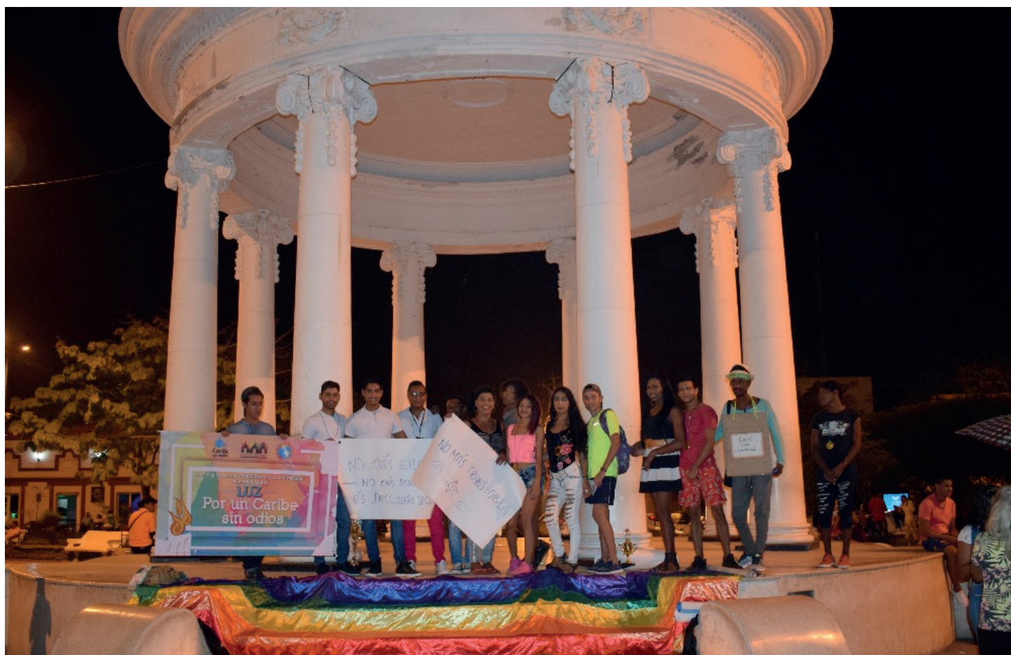
Acto simbólico en memoria de las Víctimas LGBT en Ciénaga

Por su parte en el municipio de Ciénaga Magdalena se organizaron dos actividades, una de ellas fue una jornada deportiva en la Cancha de Fútbol de Cajamag, actividad en la que se contó con la participación aproximadamente de treinta (30) personas, entre ellos todos los colectivos LGBT del municipio, la Secretaria de Gobierno desde su enlace LGBT y la Secretaria de Cultura y Deporte