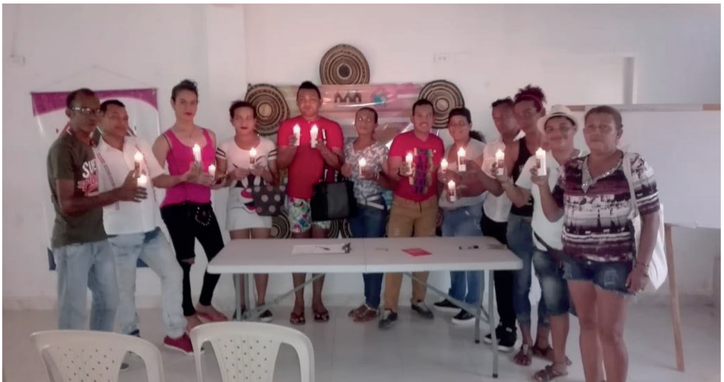
Acto de la Luz contra el odio en Casa de Paz de El Carmen.

En el municipio de Carmen de Bolívar, a través de la Casa de Paz, se programó