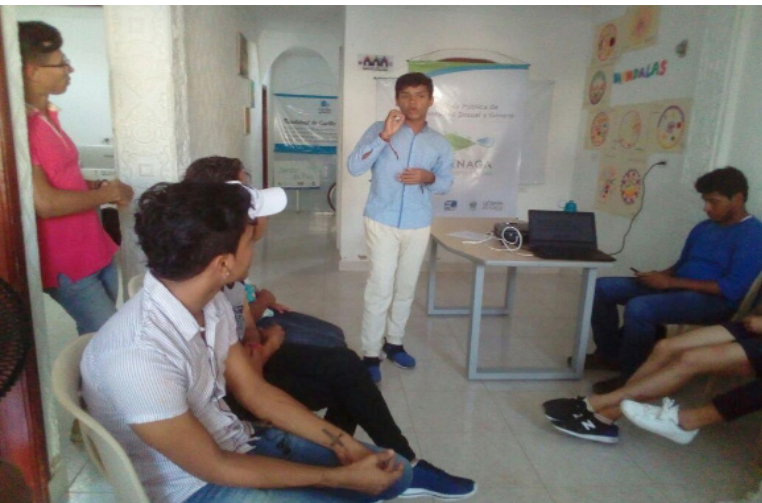
Foto: Grupo focal para Política Pública en Casa de Paz Ciénaga.

Para los talleres se desarrolló una metodología que se fundamentó en una serie de técnicas interactivas y un trabajo teórico-práctico que buscaban generar y consolidar herramientas y propuestas de movilización social e incidencia política a personas LGBT víctimas y a sus organizaciones a través de exposiciones magistrales por medio de talleres, en las cuales se abordaron generalidades sobre diversidad sexual, aspectos claves con al acuerdo de paz y el enfoque de género, aproximaciones conceptuales a los procesos de incidencia política, para luego desde espacios de trabajo conjunto entre las organizaciones y el equipo facilitador del proceso se consolidaran propuestas e insumos para la construcción de propuestas para políticas públicas de paz con enfoque de género.