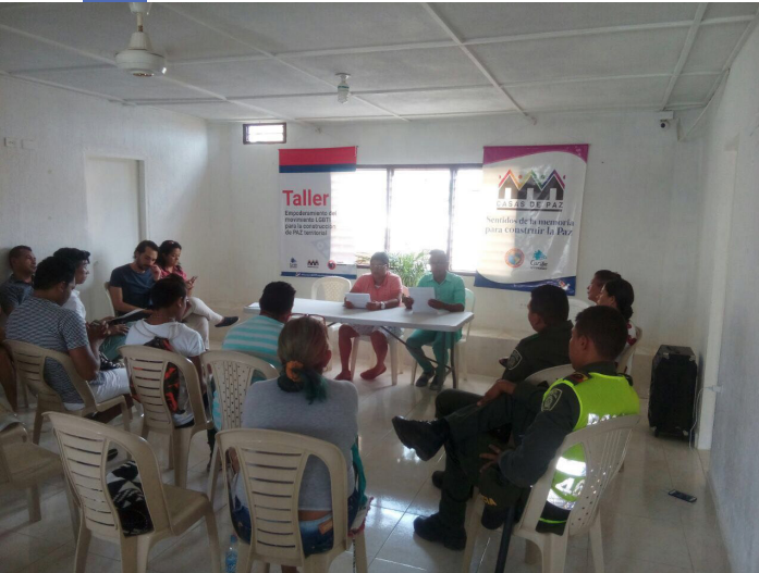
Foto: Comité comunitario reunido en Casa de Paz Maicao.

El laboratorio está planteado para desarrollarse en tres etapas.