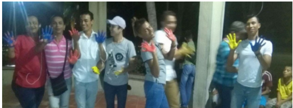
Foto: inmigrantes venezolanos participando de actividades de Casa de Paz de Maicao.

En promedio el 57% de las personas que asistieron a los talleres aumentaron su conocimiento.