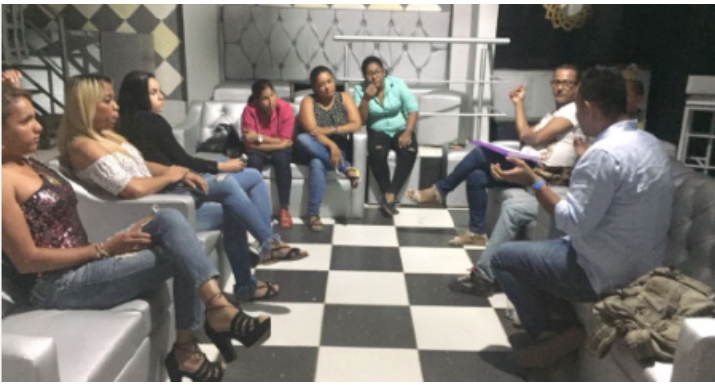
Foto: reunión Enterezas en Montería.

derechos humanos y garantías de derechos.