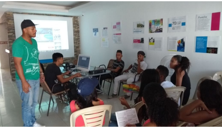
Foto: Actividad en Casa de Paz Soledad.

Con la realización de talleres en derechos y avances jurídicos para personas LGBTI, salud sexual y prevención del VIH, reuniones de formación para la construcción de documentos conceptuales de política pública LGBTI, se está formando y fortaleciendo las capacidades locales de las organizaciones de base, los activistas y a los líderes y lideresas de los municipios.