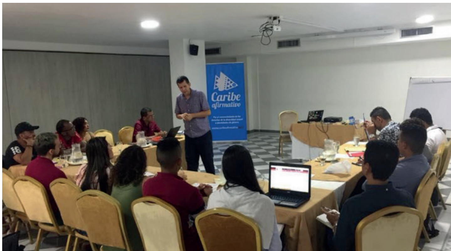
Foto: Planeación equipo Caribe Afirmativo.