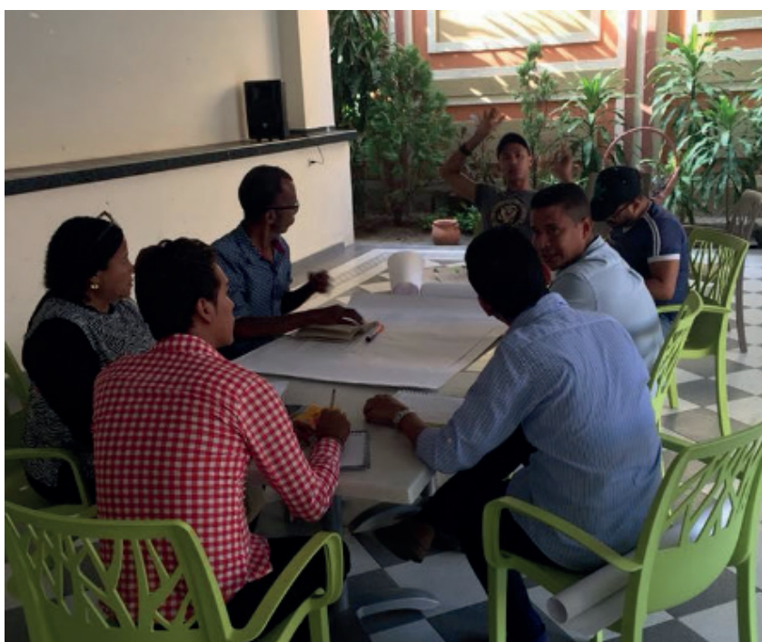
Foto: Planeación coordinadores y coordinadora de Casas de Paz.