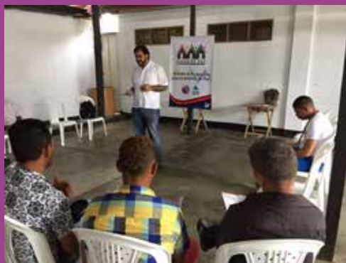
Comité Comunitario - El Carmen de Bolívar

En el municipio de El Carmen de Bolívar asistieron personas de la sociedad civil, las instituciones públicas y líderes y lideresas sociales LGBTI con la intención de conocer a profundidad sobre los comités comunitarios y el aporte que cada uno puede brindar. El comité lo conforman 7 personas