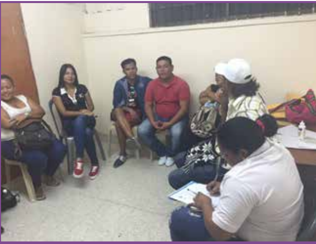
Grupo de trabajo de la casa de paz de Maicao