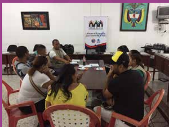
Comité Comunitario de Maicao

En el municipio de El Carmen de Bolívar asistieron personas de la sociedad civil, las instituciones públicas y líderes y lideresas sociales LGBTI con la intención de conocer a profundidad sobre los comités comunitarios y el aporte que cada uno puede brindar. El comité lo conforman 7 personas