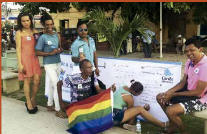
Grupo de trabajo de la casa de paz de el Carmen de Bolívar