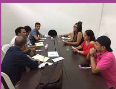
Comité Comunitario de Soledad