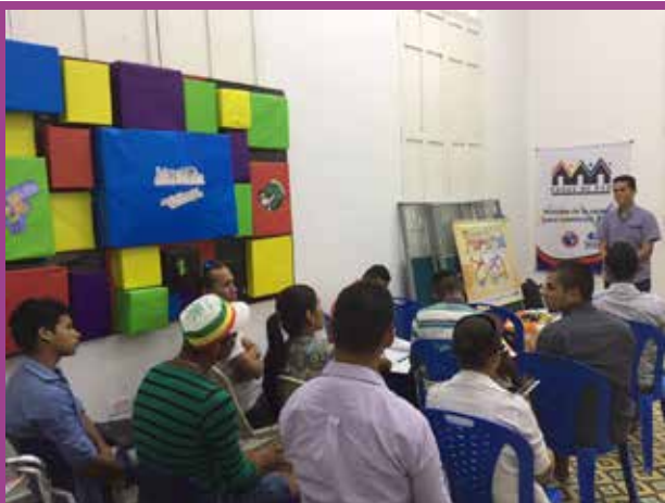
Comité Comunitario de Ciénaga