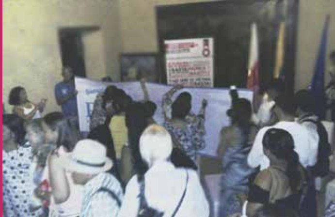
Grupo de trabajo de la casa de paz de Soledad