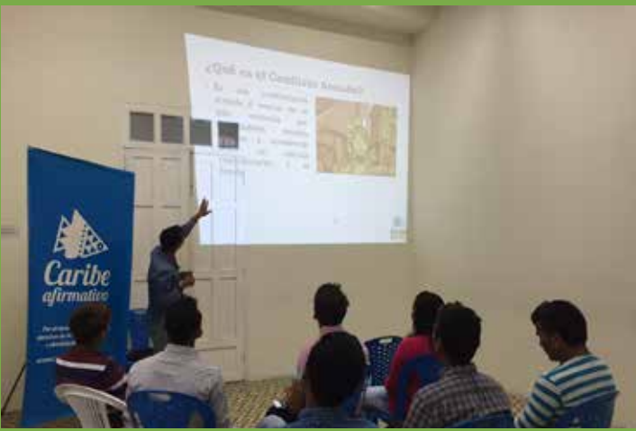
Grupo de trabajo de la casa de paz de Ciénaga