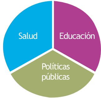
Gráfico 1 Prioridades Población LGBTI

Fuente: Elaboración basada en la información de Caribe Afirmativo, 2016